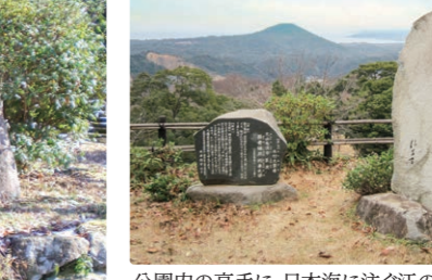
公園内の高手に、日本海に注ぐ江の川と屋上の山を望む展望台がある。

揮毫者: 奈良女子大学名誉教授 坂本信幸 先生 碑文: 笹の葉は み山もさやかに さやげども 我は妹思ふ 別れ来ぬれば (万葉集 巻2 133)