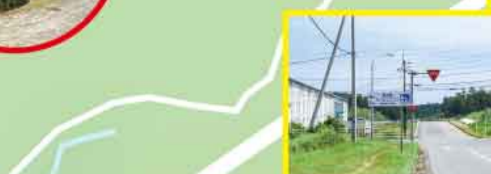
蔵庭 / 納麦