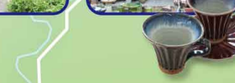
蔵庭 / 納麦