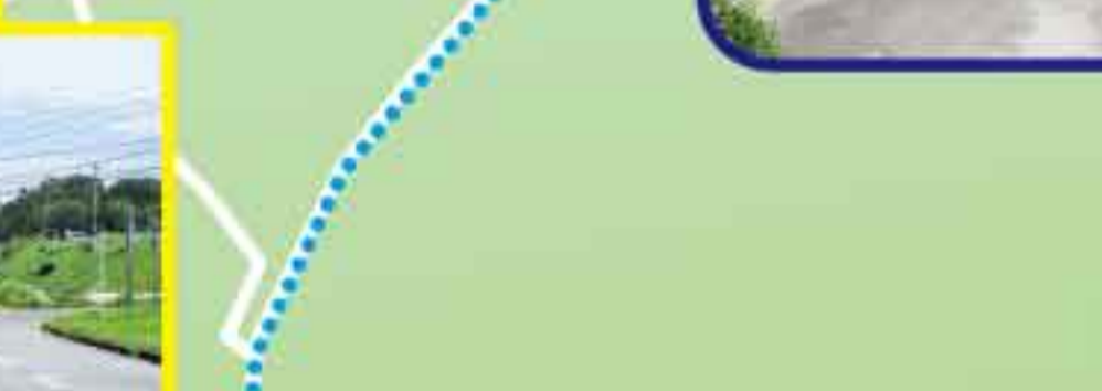
蔵庭 / 納麦