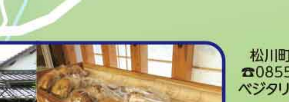
トラットリア キッツキ